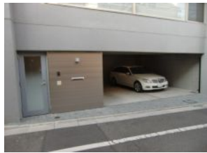
ビルトインガレージ