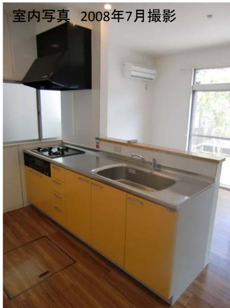
室内写真 2008年7月撮影