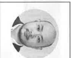
執筆：エズアセット Betty 若村 崇社社長